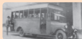
O segundo ônibus de Joinville