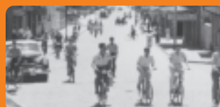
A bicicleta era tão popular que Joinville ficou conhecida como Cidade das Bicicletas