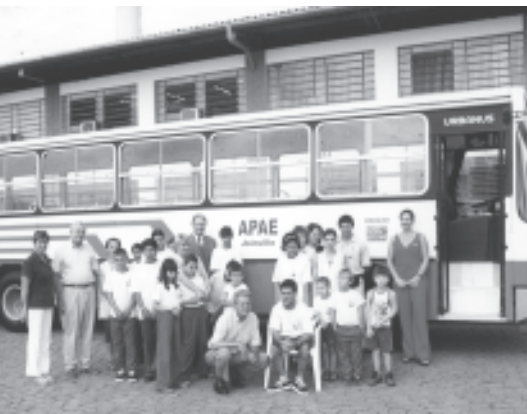
momento da doação de um ônibus à Apae