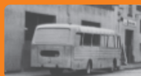
A Nielson, hoje Busscar produziu os primeiros ônibus de Joinville

★ Em 1957 começou a circular o primeiro ônibus de carroceria metálica, produzida na empresa joinvilense Irmãos Nielson.