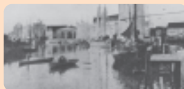
Transporte pelo rio Cachoeira

★ Nas primeiras cinco décadas após a fundação, o transporte em Joinville era feito de bicicleta, carroça, trole e, principalmente, cavalo. Precárias embarcações ligavam Joinville a São Francisco do Sul, pelo rio Cachoeira.