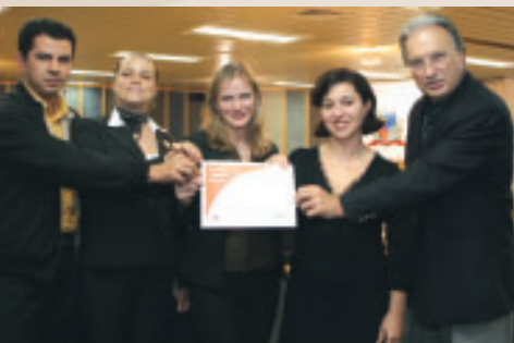
Envolvimento comunitário garantiu à Gidion o selo de "Empresa Cidadã"