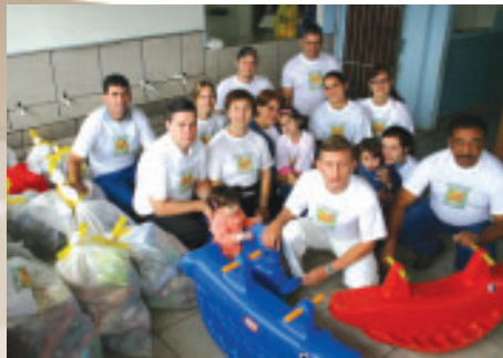
Colaboradores se envolvem voluntariamente nas campanhas sociais

Uma prova de que a Gidion também atua junto à comunidade é a conquista do Selo Empresa Cidadã, por quatro anos consecutivos, e a publicação do balanço social. A empresa mantém ainda um serviço de atendimento ao cliente e realiza pesquisas de satisfação. Contribui com o projeto Florir Joinville e com a Associação dos Amigos dos Autistas, além de apoiar outros projetos e ações sociais e realizar atividades com grupo de voluntariado.