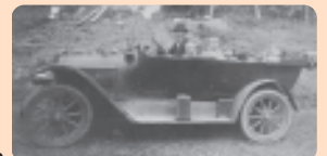
O primeiro automóvel de Joinville

★ No dia 17 de maio de 1907 circulou o primeiro automóvel na cidade.