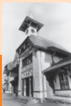
Estação Ferroviária: um símbolo do transporte de trem